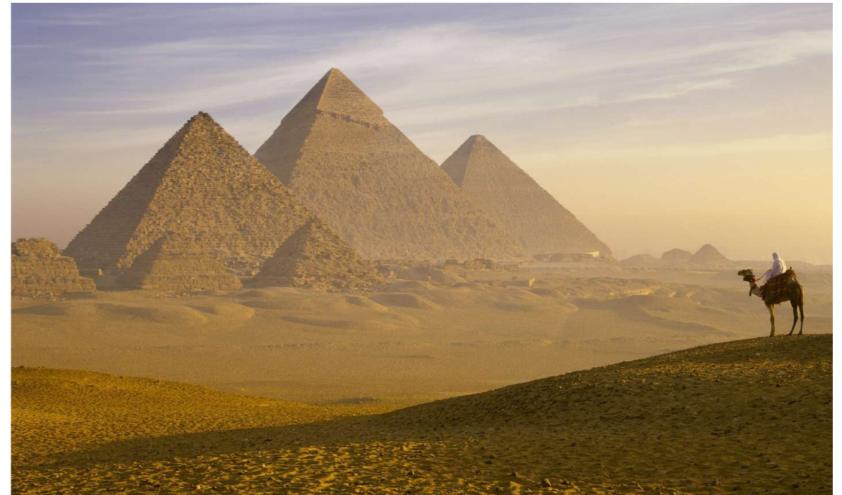
Pirámides de Guiza