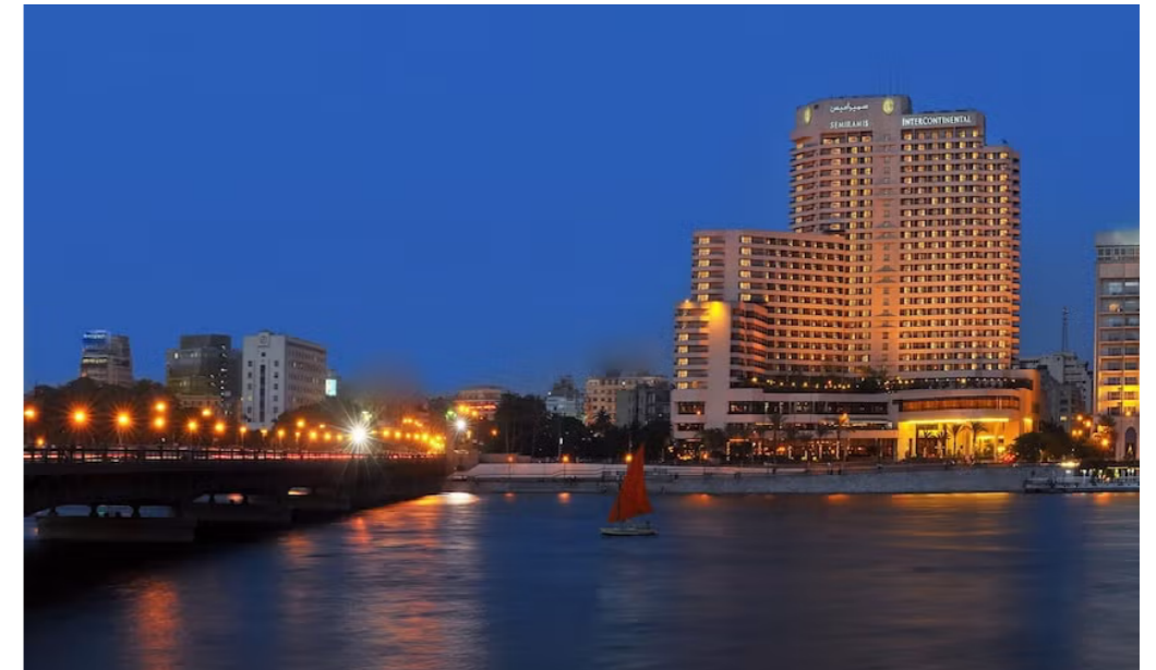
Hotel Intercontinental Semiramis visto desde el Nilo

Uno de los hoteles más emblemáticos y con mayor historia de la capital egipcia. Se encuentra a orillas del Nilo en pleno distrito diplomático de la ciudad a sólo 250 metros de la plaza Tahrir. Dispone de una piscina en la azotea con vistas al río.