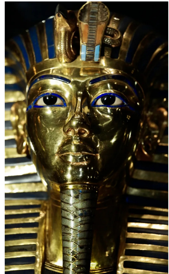
Máscara de Tutankamón

Uno de los hoteles más emblemáticos y con mayor historia de la capital egipcia. Se encuentra a orillas del Nilo en pleno distrito diplomático de la ciudad a sólo 250 metros de la plaza Tahrir. Dispone de una piscina en la azotea con vistas al río.