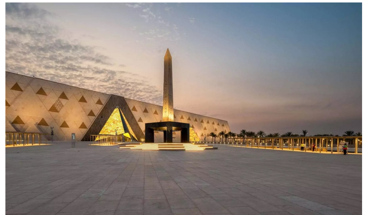
Gran Museo Egipcio

Una parte de los pagos se ha efectuado en dólares a los proveedores. Cualquier variación importante en el tipo de cambio del dólar podría dar lugar a la revisión del precio final. El cambio del dólar con el que se elaboró este presupuesto es de 1€ = 1,17$